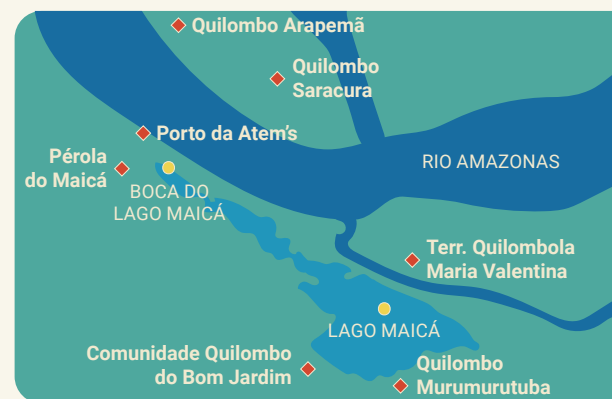
Portos podem impactar comunidades quilombolas que vivem da pesca no Lago Maicá.