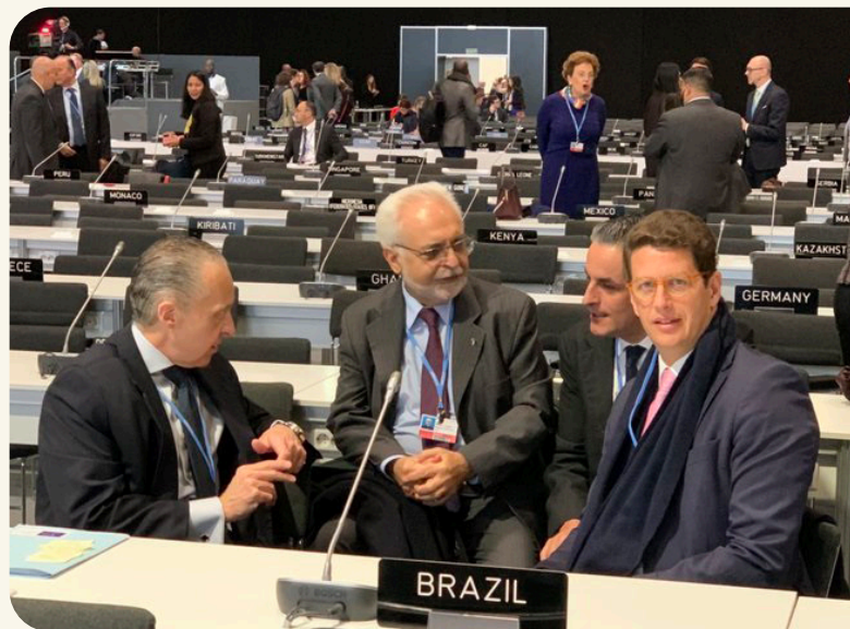
O ministro de Meio Ambiente, Ricardo Salles, participou COP 25 sem qualquer tipo de diálogo democrático com a sociedade.

Em 2019, a realização da 25ª Conferência das Partes da Convenção-Quadro sobre Mudança do Clima em Madri, na Espanha, foi marcada pela tentativa de