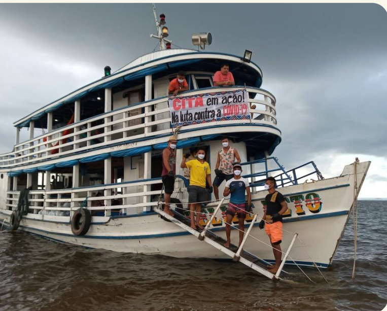
Cita organizou distribuição de cestas para as aldeias do Baixo Amaxonas.

O avanço do coronavírus sobre os territórios da Amazônia exigiu uma rápida adaptação na organização de indígenas, quilombolas e povos e comunidades tradicionais para garantir a segurança de todos e de todas.