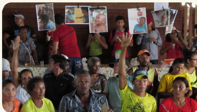
Protocolo de Consulta dos Quilombos de Santarém foi aprovado em assembleia e hoje é instrumento fundamental na luta quilombola.

Assim, vemos que o desafio de fazer os protocolos de consulta serem respeitados passa cada vez mais pela tentativa de seu reconhecimento pelo Estado, pelo Poder Judiciário ou Poder Executivo. Ou seja, seu constante uso diante do poder público, sem abrir mão de seu conteúdo e poder de veto, poderá dar frutos valiosos e precedentes positivos.