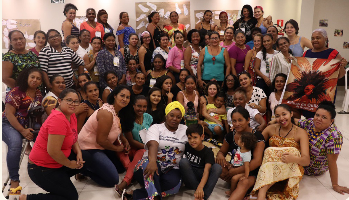
Encontro de Mulheres Quilombolas.